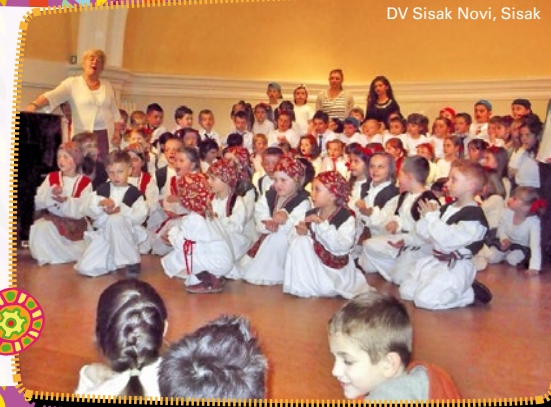
DV Sisak Novi, Sisak