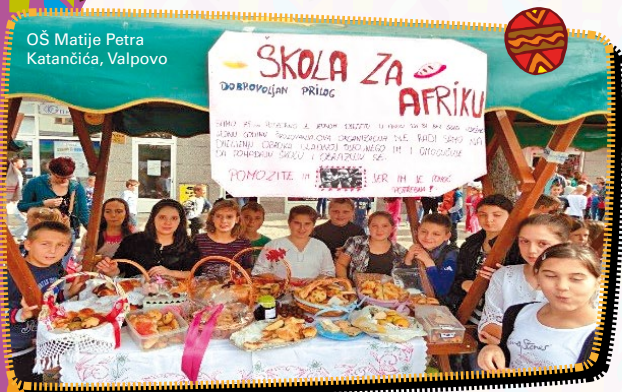
OŠ Matije Petra Katančića, Valpovo

Na središnjem valpovačkom trgu učenici Osnovne škole Matije Petra Katančića i područnih škola iz Narda, Šaga i Bocanjevaca uz pomoć svojih učiteljica i učitelja uredili su štandove šarolikim jesenskim plodovima i mirisnim pekarskim proizvodima što su ih pripremile njihove vrijedne ruke uz pomoć roditelja. Iznos od prodaje doniran je projektu „Škole za Afriku“. Na božićnoj priredbi izvedene su razne recitacije, glazbene točke, plesovi, igrokazi, a završni dio same priredbe bio je posvećen osvješćivanju problema s kojima se susreću djeca u Africi. Učenice su pri ulasku u dvoranu svim posjetiteljima poklanjale svitke s porukama dobrote, mira i nade.