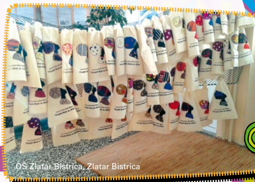
OŠ Zlatar Bistrica, Zlatar Bistrica

Na školskoj priredbi u Osnovnoj školi Zlatar Bistrica predstavljen je projekt UNICEF-a „Škole za Afriku“ roditeljima i mještanima te ostalim posjetiteljima. Nakon programa svi prisutni pozvani su da se pridruže prodajnoj izložbi dječjih radova i daju svoj doprinos za obrazovanje djece u Africi. Posebnu pozornost posjetitelja privukle su prekrasne torbe s motivom žene iz Afrike. Svaka je unikatna i posebna.